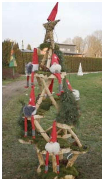
Burbiškio bendruomenės eglutė. 11 psl.