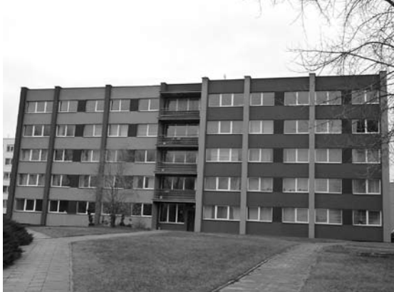
Tikėtina, jog šiame buvusiam Anykščių technologijos mokyklos bendrabutyje bus įkurtas ekonominės klasės viešbutis.