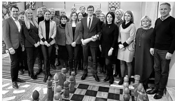
Po naujojo skyriaus pirmininko rinkimų Anykščių liberalai pozavo bendrai nuotraukai.

Net ir 2015-aisiais, kai tiesioginius Anykščių rajono mero