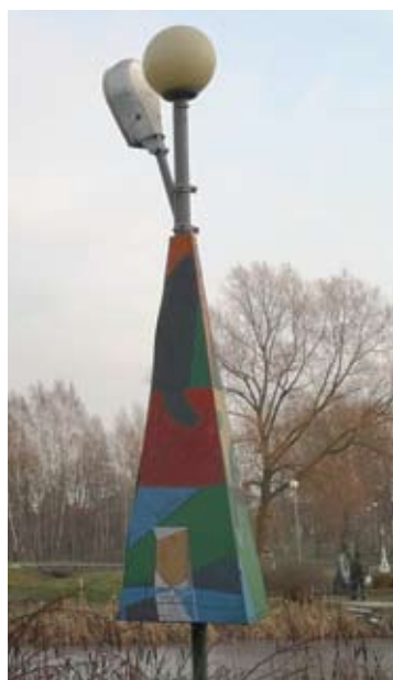
Anykščių kūrybos ir dailės mokyklos kolektyvas eglutę įkėlė į apšvietimo stulpą.