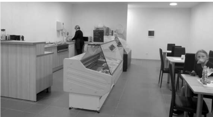
Buvusios Anykščių pieninės pastate (Vilniaus g. 20) kepyklėlė-kavinė nuomojasi erdvas patalpas.

Maitinimo įstaiga, kurioje turbūt greičiausiai Anykščiuose klientui atnešami patiekalai, dabar veikia buvusios Anykščių pieninės pastate, adresu Vilniaus g. 20.