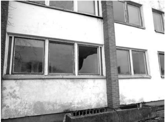
Valstybinio turto banko valdomas bendrabutis išdaužytais langais ir atjungtu centriniu šildymu.

Jau šiais mokslo metais technologijos mokykla bendradarbiauja ir su A.Baranausko pagrindine mokykla, ir su J.Biliūno gimnazija.