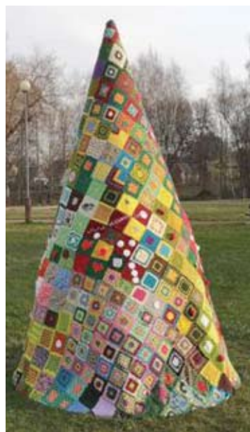
Meztoji eglutė. Jai skiautes mezgė mezgėjos iš visos Lietuvos.