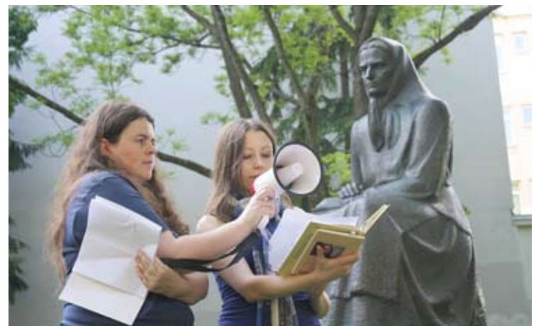
Poezijos pavasaris. Moterų skaitymai prie Žemaitės paminklo.

- Į Anykščių viešąjį gyvenimą dar neišitraukiau. Labai daug dirbame savo sodyboje, nes patys savo rankomis rekonstruojame senus sodybos pastatus, o aktyvizmas atima labai daug laiko bei reikalauja nemažai resursų, ir nėra skirtumo, kokio dydžio mieste tuo užsiimi. O dėl visuomeninio gyvenimo mažose bendruomenėse, tai jis gali turėti tiek didelių privalumų, tiek trūkumų. Pavyzdžiui, labai patogų ką nors organizuoti mieste, kuriame visus pažįsti, bet gali būti labai sunku gyventi, jei tavo pažiūros nesutampa su dominuojančios, valdžią turinčios grupės interesais.