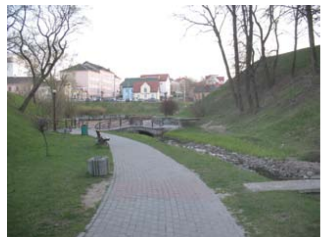
Kauno dyžio Gardinas valdytas ir rusų, ir lietuvių, ir lenkų.