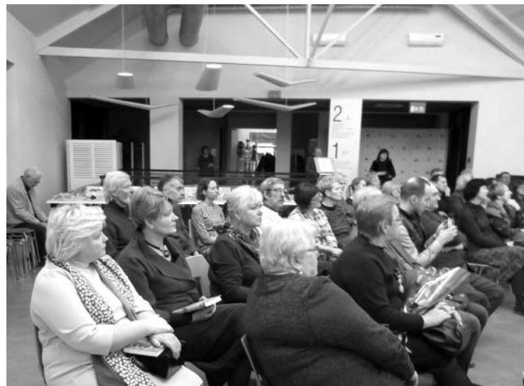
Knygos „Memento Grodno. Dingusi Lietuvos Gardino istorija“ pristatymas Anykščiuose buvo pats pirmasis.